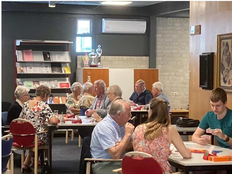
Concentratie tijdens het spelen op de zondagmiddagdrive