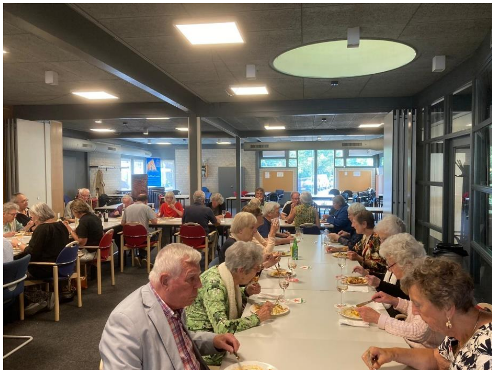
Ontspanning na afloop tijdens het buffet